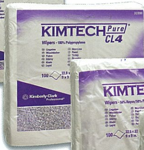
金特* W4 無塵擦拭布