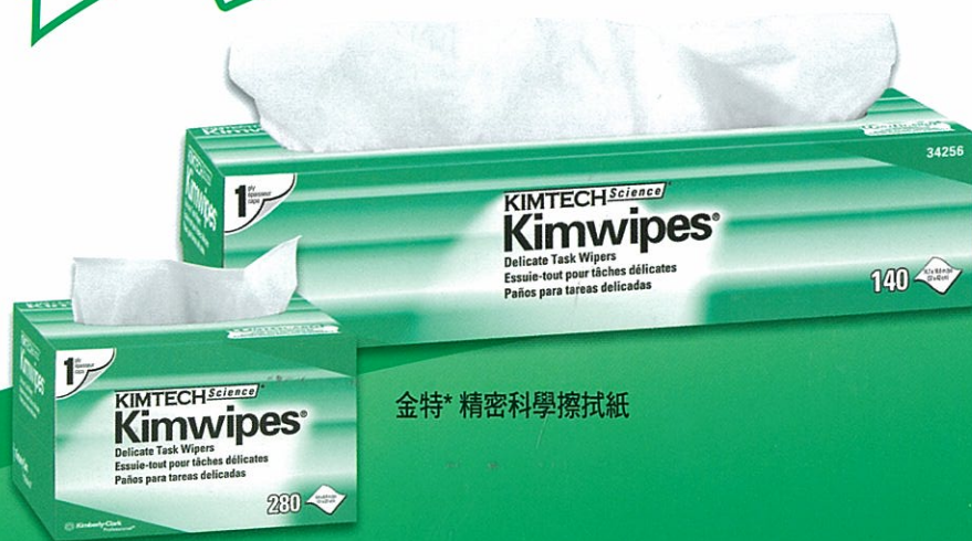
金特* 精密科學擦拭紙